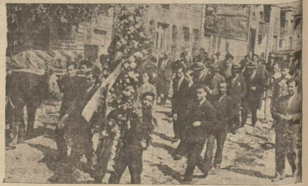
Cenaze merasiminden bir intiba