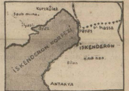
Antakya ve İskenderonu gösterir harita