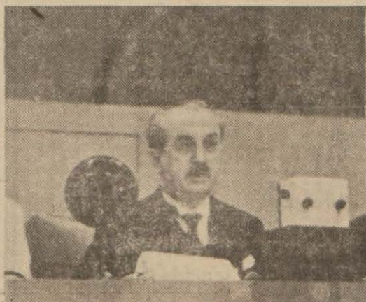
Maarif Vekili Saffet Arıkan