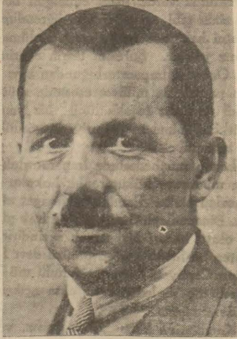
Adliye Vekili Şükrü Saraçoğlu